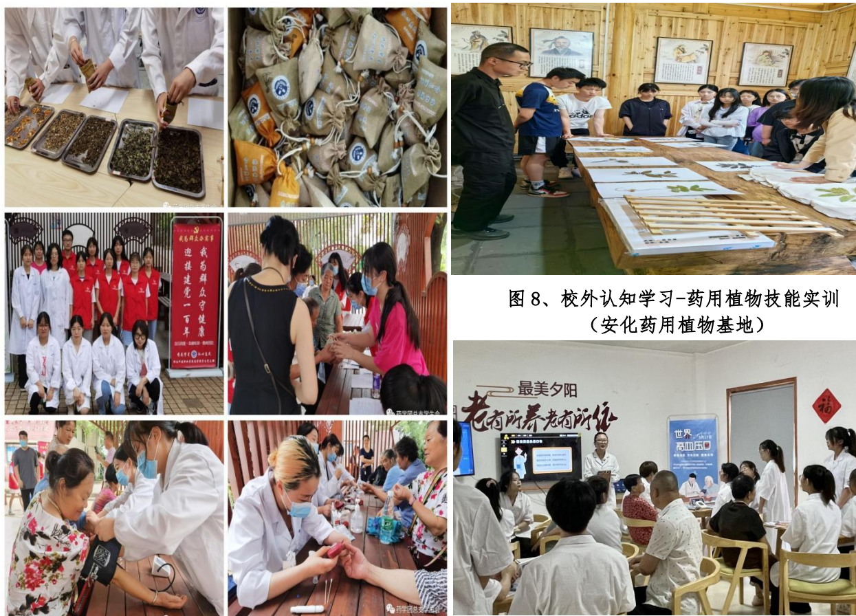
图 8、校外认知学习-药用植物技能实训 (安化药用植物基地)

一年级学生负责居民用药常识调研，二年级学生负责健康科普教育，三年级学生在老师指导下负责患者随访等活动，以此逐步达成职业认知、职业体验、职业融入三阶段的活动模式。“药苑繁星、仁心惠民”党建品牌建设与专业学习相互促进，通过健康检测及慢病防治等活动的开展促使参与学生更有需求和目的去掌握慢病预防及用药知识，通过服务群众为学生提供了药学服务方面的案例分析和合理用药等资料，更加有效地做到学用结合，在服务群众的同时促进知识和专业技能的提升。这些实践机会不仅能够帮助学生巩固所学知识，还能够培养他们的实践能力和团队协作精神。