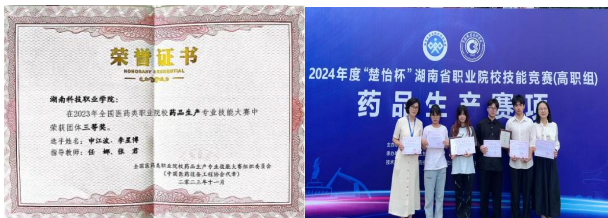
图 10、药品生产专业技能大赛