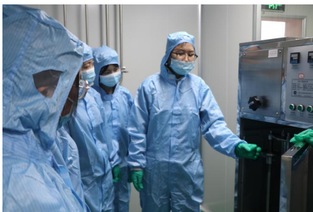
图 5、药物制剂生产技能实训